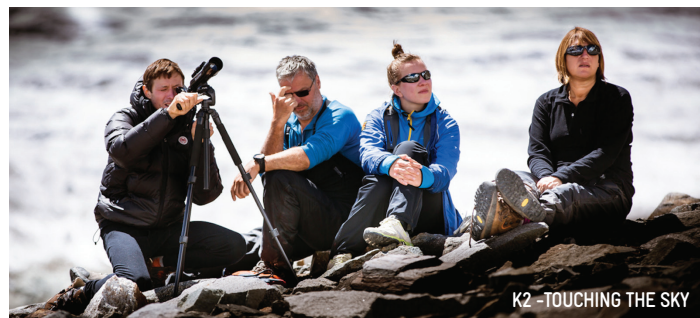
K2 - TOUCHING THE SKY

Città-di-Imola-Preis bei der 64. Ausgabe des Trento Film Festivals 2016