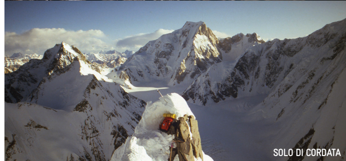
SOLO DI CORDATA