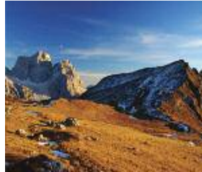
Il Pelmo verso sera Enrico Campana