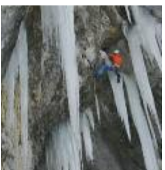
BERGE IM KOPF