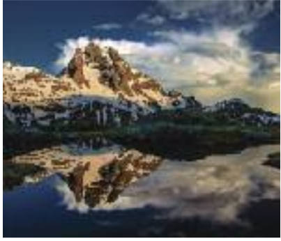
Pizzo Recastello Claudio Ranza