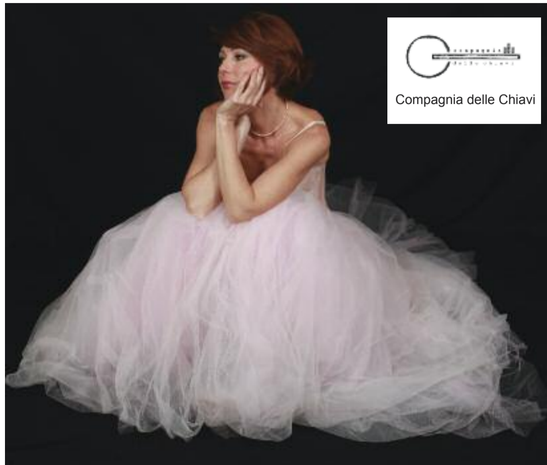
Silvia Lorenzi - Il soprano

Suoni, musica, immagini e performance in uno spettacolo in anteprima nazionale tutto da scoprire. A cura del soprano Silvia Lorenzi, live music Fabio Piazzalunga, con l'attore Christian Cestaro