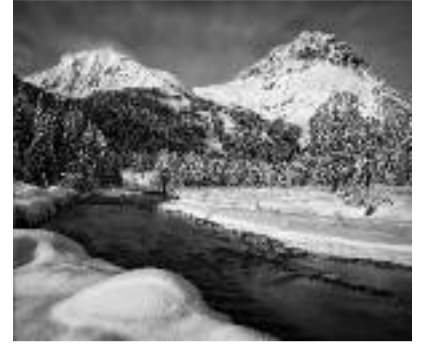
Inverno al Gaver Giordano Bertocchi