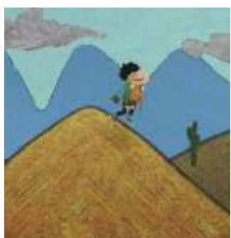
LA PIEDRA DEL RAYO