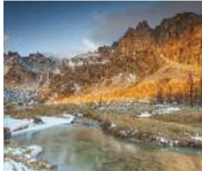
Alba autunnale in Val Buscagna Giordano Bertocchi