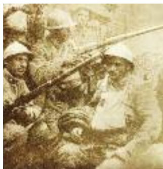
LAGRANDE GUERRASUL-L'ALTOPIANO DI ASIAGO