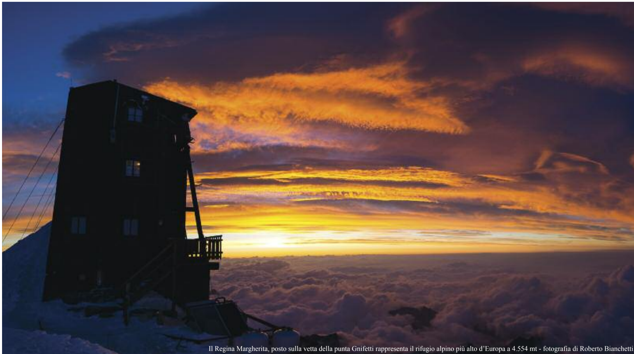
Il Regina Margherita, posto sulla vetta della punta Gnifetti rappresenta il rifugio alpino più alto d'Europa a 4.554 mt.