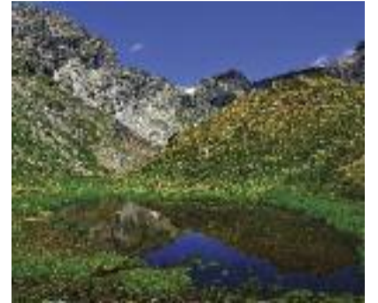
Riflessi di montagna Franco Marchi