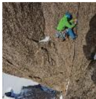
THE LAST GREAT CLIMB

UK, 2013, 60' Regia di Alastair Lee Produzione: Posing Productions Inglese con sott. italiano Sezione Terre alte del mondo