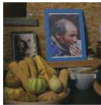
PERDUTAMENTE CERRO TORRE