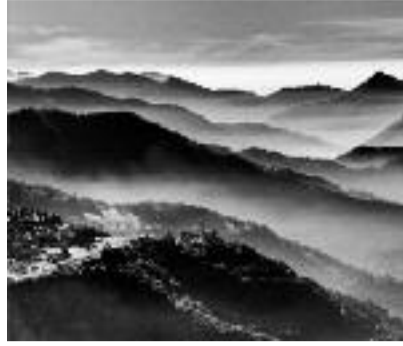
Profili di monti Fabio Ghisalberti