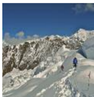
L'INUTILE E L'ESSENZIALE

Nockberge represents the oldest landscape in Austria from the geological point of view. The territory changed a lot, but mountain not. Traditional farming and the National Park have kept out the mass tourism that blighted other Alpine regions.