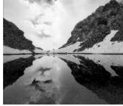
Bellezze al bagno Daniele Passoni