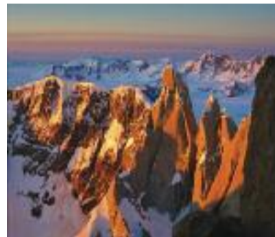
Alba sul Cerro Torre