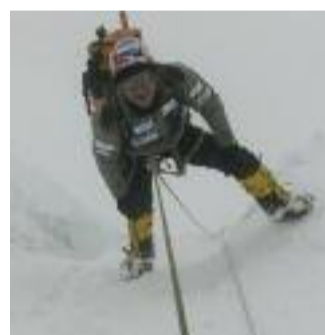
KANGCHENJUNGA I cinque tesori della grande neve

Italia, 2013, 62'' Regia di Paolo Paganin Produzione: DokuDoku Lingua italiana Sezione terre alte del mondo