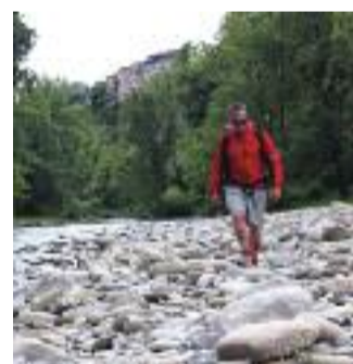
ALTA VIA DEI PARCHI Viaggio a piedi in Emilia Romagna

Four mountaineers discover mountain routes, alpine crystals and their personal limits, but not all the answers to their questions about risk, freedom and their place on earth.