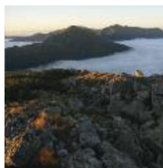
NOCK MOUNTAINS AT HEAVEN'S DOOR

Austria, 2013, 52' Regia di Waltraud Paschinger Produzione: dreiD.at Filmproduktion per ORF Lingua italiana Sezione Terre alte del mondo