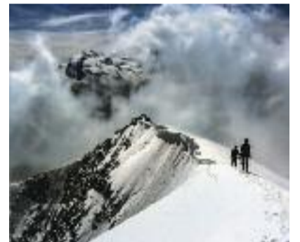
Zinalrothorn Claudio Ranza