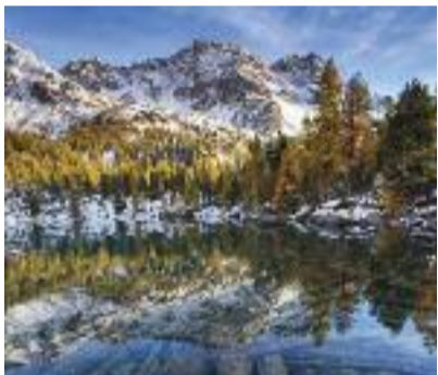
Autunno al lago Saoseo Giordano Bertocchi