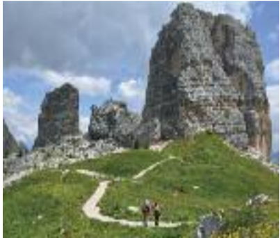
Sul sentiero delle Cinque Torri Ettore Ruggeri