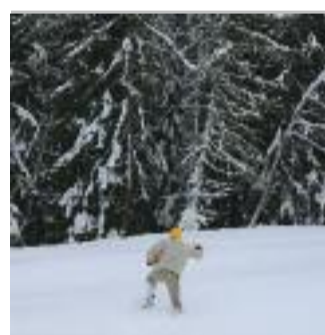
CHIEDILO A KEINWUNDER

The movie tells the story of a group of young blind athletes of Bologna CUS who have the passion of climbing. Teenagers with a strong will who practise a very difficult sport.