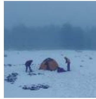
JABAL ALI DI GHIACCIO

In this potentially deadly situation where trust is an absolute necessity, the relationship is put to the test as Agnes reveals Ragnar's disturbing secret.