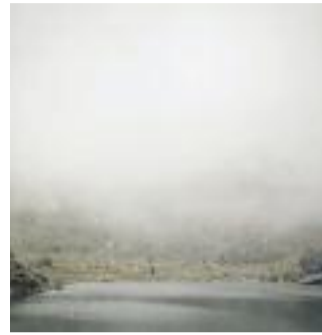
GLENO DOVE FINISCE LA VALLE